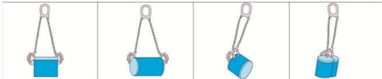
Рисунок 3. Варианты использования захвата для бочек.