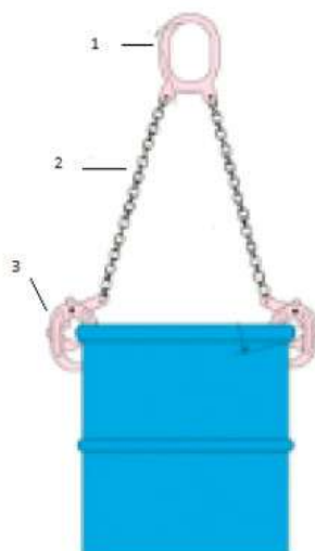
Рисунок 2. Устройство захвата.

Захват состоит из стального овального звена (1), двух цепных ветвей (2), двух рычажных захватов на концах цепных ветвей (3) Рисунок 2.